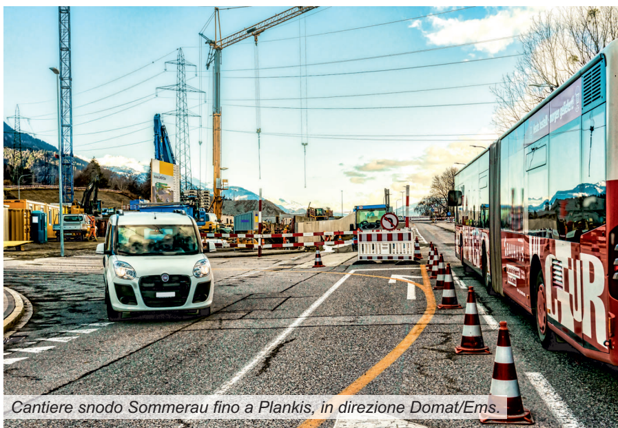
Cantiere snodo Sommerau fino a Plankis, in direzione Domat/Ems.

Queste misure edilizie sono pensate affinché anche in questo periodo difficile la sicurezza d'esercizio e la