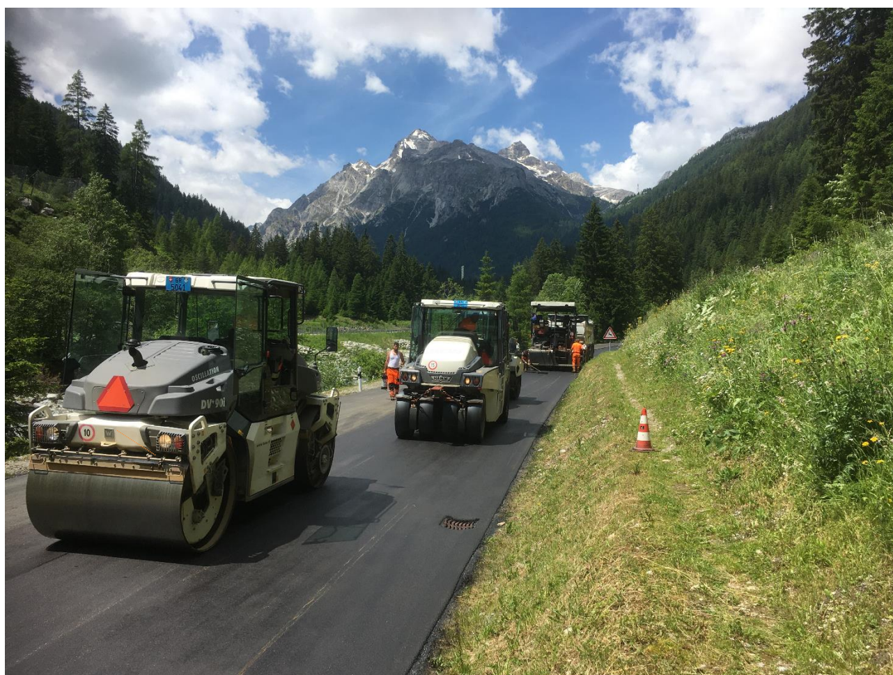
H13 Strada italiana, Sufers Crestawald, km 44.40 – 46.20