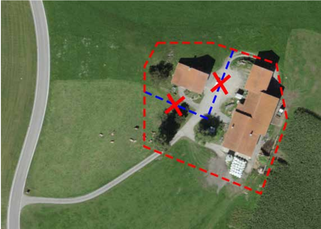
Abb. 3: Keine Abtrennung einer Baute innerhalb des Hofes