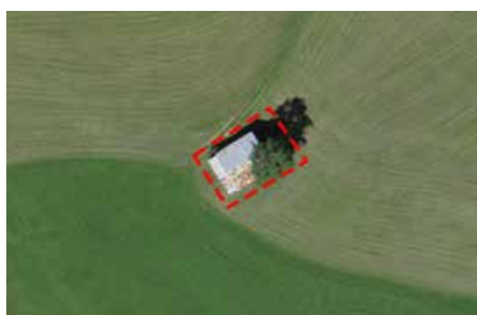
Ill. 2: Separazione di una stalla esterna / di un'abitazione temporanea