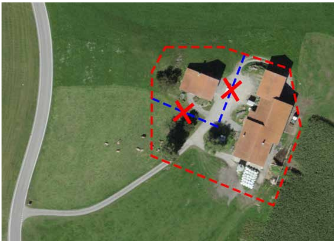
III. 3: Nessuna separazione di un edificio all'interno della fattoria