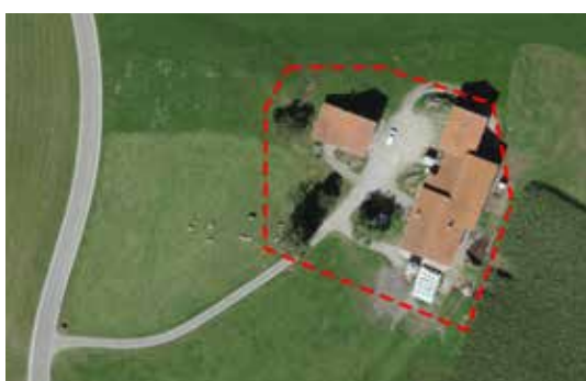
Ill. 1: Separazione di un centro aziendale

Di norma vengono separati singoli edifici abitativi o stalle, interi centri aziendali, stalle esterne isolate o abitazioni temporanee.