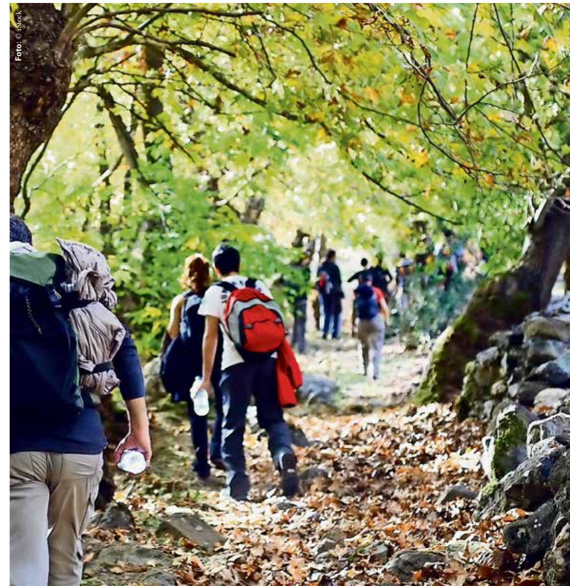
... gemeinsame Wanderungen stehen bei allen hoch im Kurs.