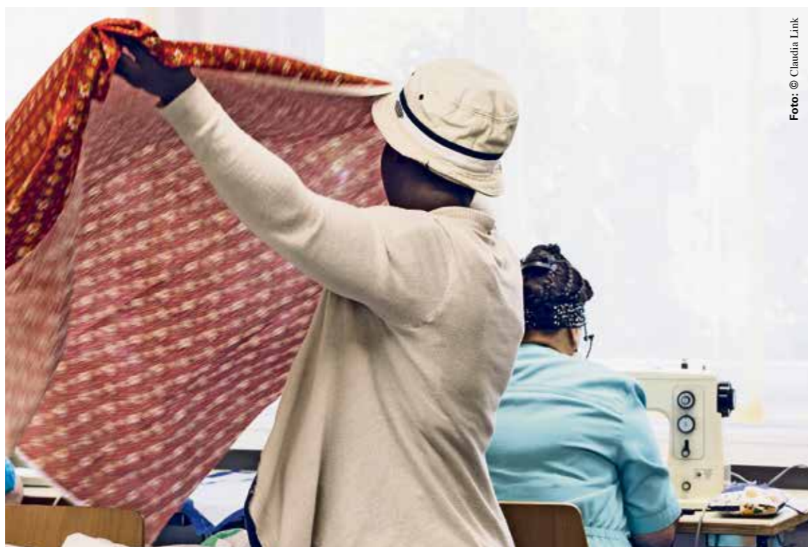
Emsige Frauen am Werk: Es wird genäht, gefädelt und nebenbei noch Deutsch gelernt.