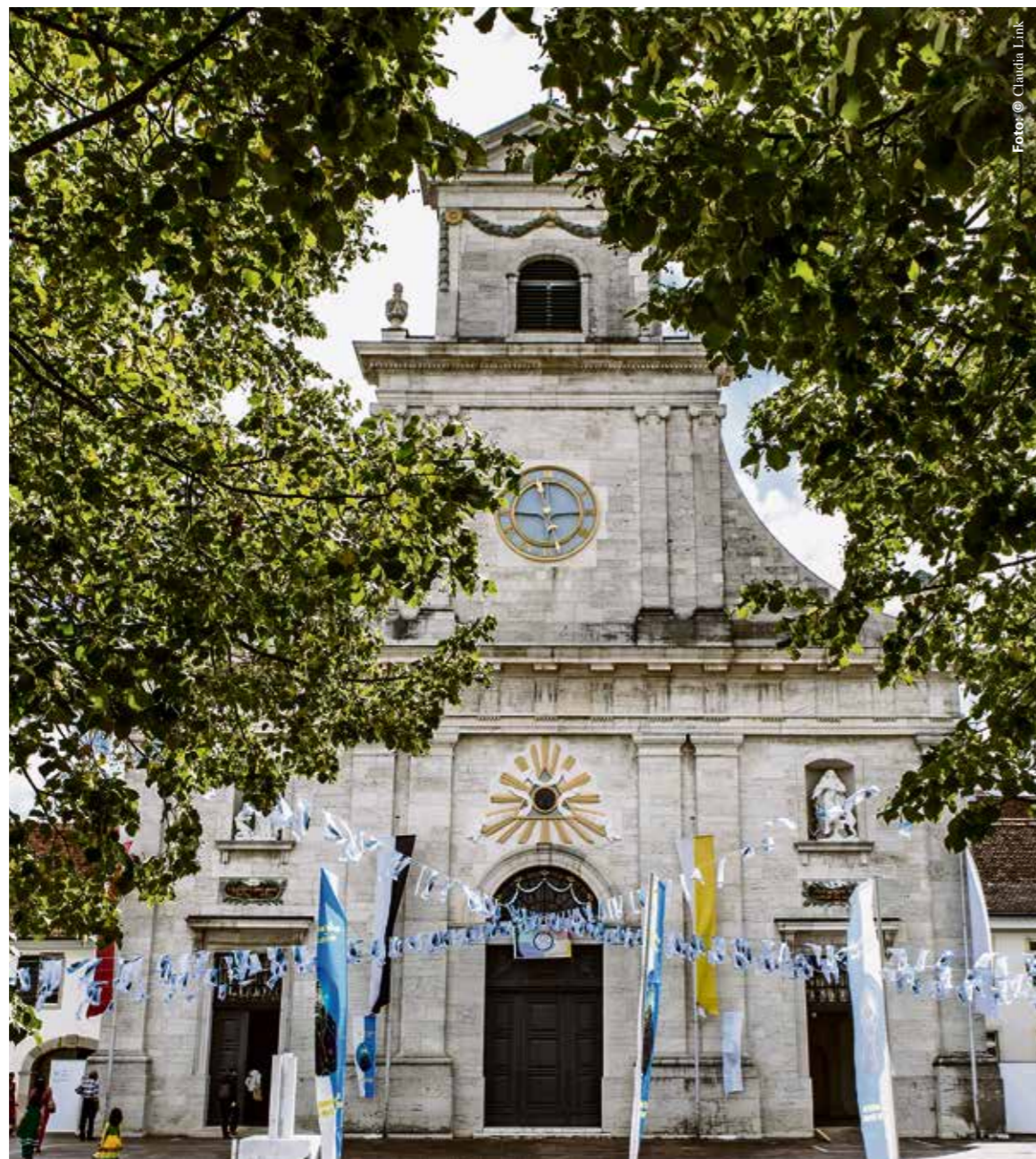
Nicht nur Katholiken kommen nach Mariastein, sondern auch Muslime und Hindus.

Längst ist Mariastein zur Pilgerstätte geworden und neben Einsiedeln der wichtigste katholische Maria-Wallfahrtsort der Schweiz. 59 Stufen führen heute vom Platz der Klosterkirche durch den Felsen in die Gnadenkapelle hinunter. In schummrigen Licht sitzen die Leute auf Holzbänken und beten zu Maria, die als prunkvolle Statue über dem Altar thront. Die Mutter Gottes gilt als Schutzheilige. Auf die Fürsprache von Maria rettet Gott, wer abstürzt – sei es gesellschaftlich, familiär oder gesundheitlich. Ihre Botschaft ist: Du wirst nicht fallengelassen,