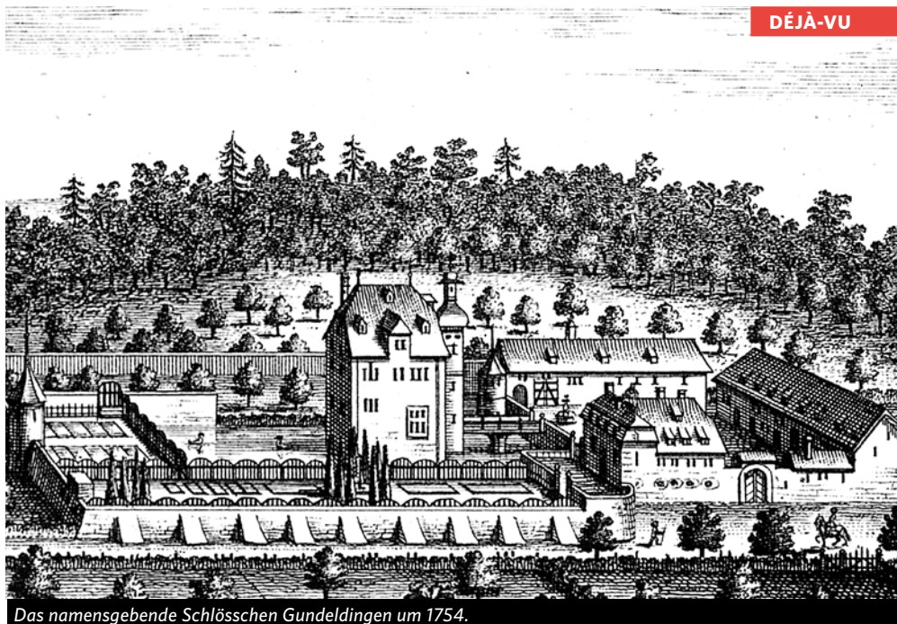
Das namensgebende Schloßchen Gundeldingen um 1754.